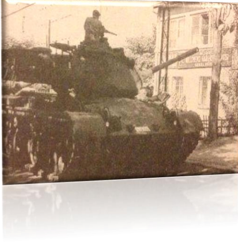
12 Eylül sabahı ve tankın namlusu MHP Genel Merkezi'ne çevrili.

Pusudakiler yeterince olgunlaşan şartların neticesi 12 Eylül 1980 sabahı askeri darbelerini yapınca, Türk Silahlı Kuvvetleri, ülke yönetimine el koydu ve tüm parti liderleri tutuklandı. Türkeş önce ailesi ile birlikte İzmir'deki Uzun Ada'da gözetim altına alınır, ardında da Ankara'da bulunan Ordu Dil Okulu'nda hapisaneye kapatılır. Hastalandığı dönemde de Mevki Hastanesinde 4,5 yıl hapis yatar. 12 Eylül darbesi ve 1980 - 82 askeri yönetim yılları, Ülkücü Hareket için büyük bir şok oldu. Başbuğ Alparslan Türkeş ve Türkiye'nin komünist bir ihtilâle kurban olmasını engelleyen Ülkücü Başbuğ Alparslan Türkeş ve Türkiye'nin komünist bir ihtilâle kurban olmasını engelleyen Ülkücü Hareket sanık sandalyesinde, idam sehpalarındadır.